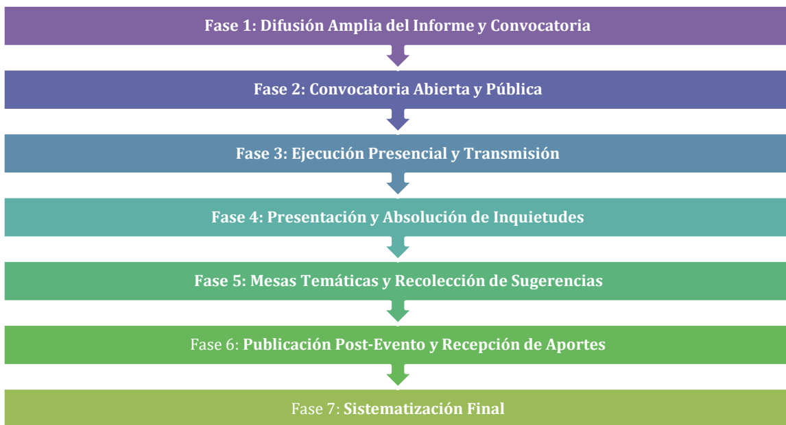
Gráfico 2: Metodología de deliberación Pública y Evaluación Ciudadana

La deliberación pública constituye el núcleo transformador de esta metodología, trascendiendo su carácter de requisito legal para convertirse en un espacio estratégico de diálogo bidireccional. Esta fase refleja el compromiso institucional con una administración ética y transparente, donde el escrutinio ciudadano se integra como motor de mejora continua, garantizando que cada decisión responda a un ejercicio participativo, riguroso y orientado al bienestar colectivo.